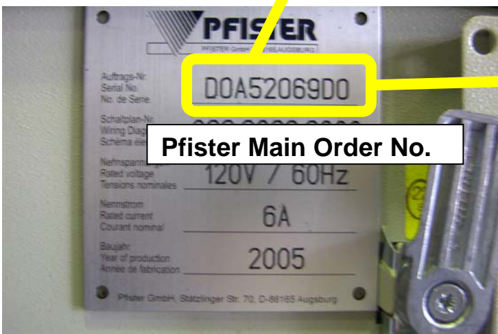
Pfister Main Order No.